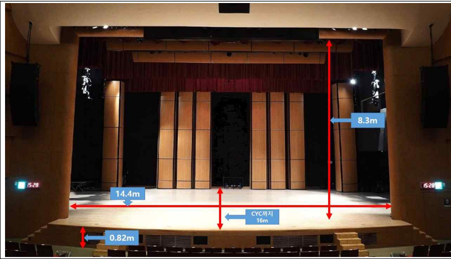
◎ 무대 및 객석 사진 (수치 표시)